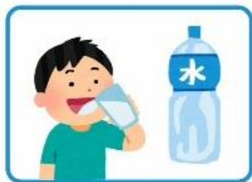
こまめな水分補給

水分は 1日1.5リットル を目安にとりましょう。寝る前、起きた時、運動の前後にコップ一杯の水分をとるとよいです。アイスクリームやゼリーなど食べやすいものでいいですよ。