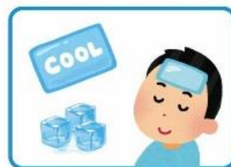
暑くなったら冷やす

体温計で体温を測る習慣をつけましょう。体温が高いときや暑いなど感じる時は知らないうちに体が熱を持っています。濡れたタオルで体を拭いたり、水で手のひらを冷やしたりしましょう。暑苦しくて寝苦しいときは、氷枕で頭を冷やすのもおすすめです。