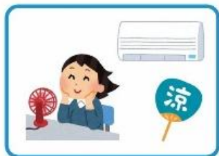
エアコン・扇風機を活用

室内の温度を 28度以下 、湿度を70パーセント以下にするとよいです。外へ出て運動や作業をするときは涼しい時間帯を選び、30分に一度休憩をとりましょう。