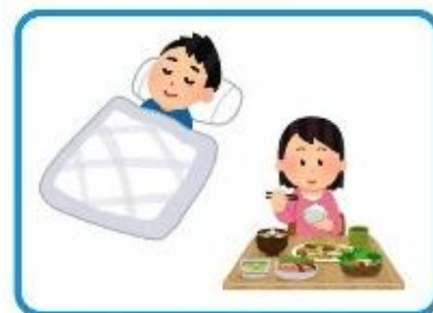
十分な睡眠と食事