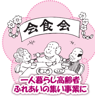
二人暮らし高齢者 ふれあいの集い事業に