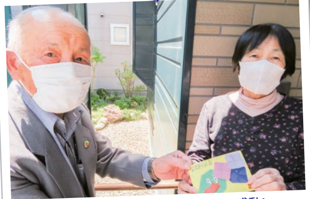
～手作りのお手紙と一言メッセージに感動!～ 朝日町サロン