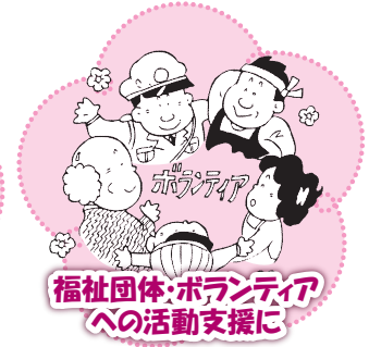
福祉団体・ボランティア への活動支援に