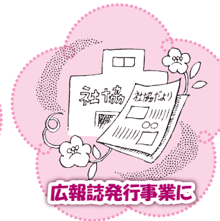
広報誌発行事業に