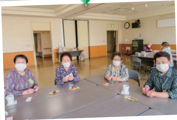
～託老利用者さんも作ってくれました～