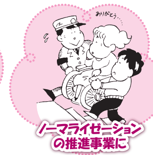
ホームライゼーション の推進事業に