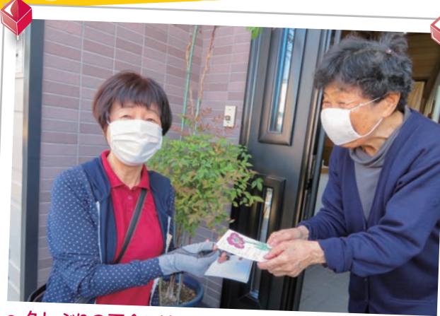
～久しぶりの再会と絵手紙にみんな笑顔になりました～ 桂木・北斗ふれあいサロン