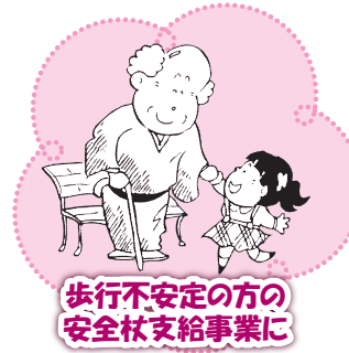
歩行不安定の方の 安全杖支給事業に