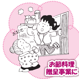
お節料理 贈呈事業に