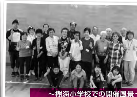
～樹海小学校での開催風景～ みんなで記念撮影ハイ!チーズ☆