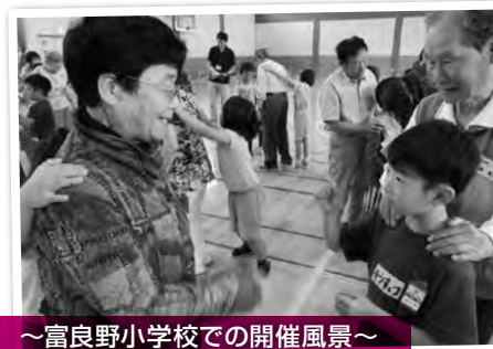
～富良野小学校での開催風景～ じゃんけん列車をしました