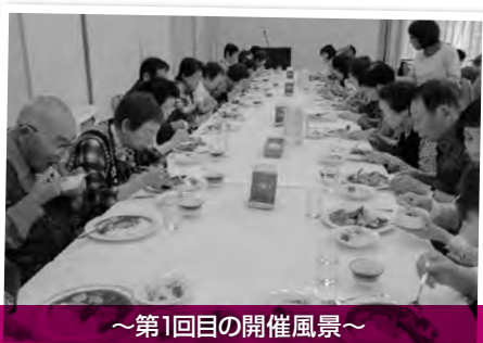
～第1回目の開催風景～ シーフードカレーぴりっと辛くて美味しいな