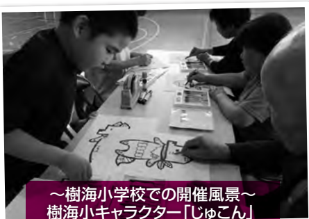
～樹海小学校での開催風景～ 樹海小キャラクター「じゅこん」 のぬり絵を一緒にしました