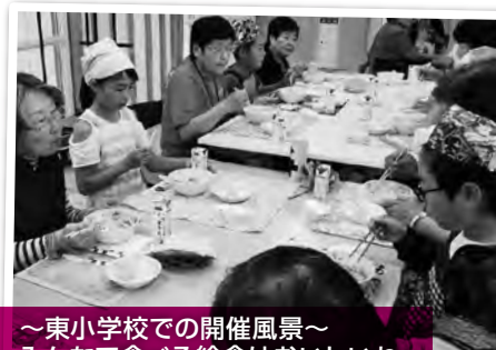
～東小学校での開催風景～ みんなで食べる給食はおいしいね