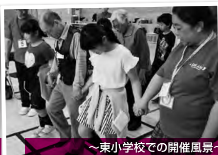
～東小学校での開催風景～ 手を繋いでふまねっと運動をしました