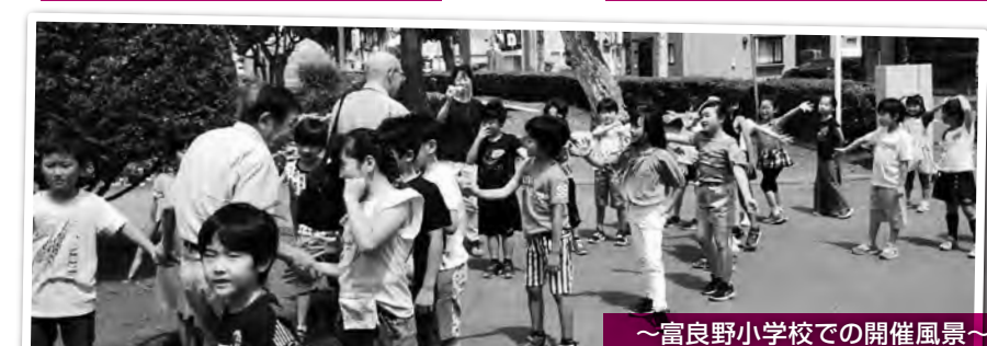
～富良野小学校での開催風景～ お見送りをしてもらいました