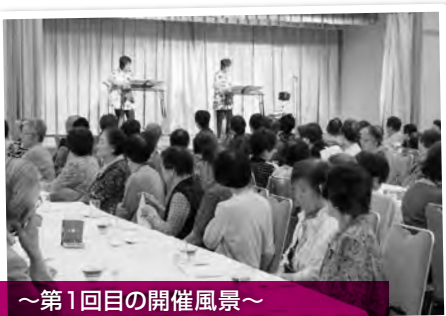
～第1回目の開催風景～ 大正琴の演奏と一緒に歌いました

扇山小学校のふれあいの集いは10月を予定していますので、参加対象者の方はぜひ参加してくださいね。