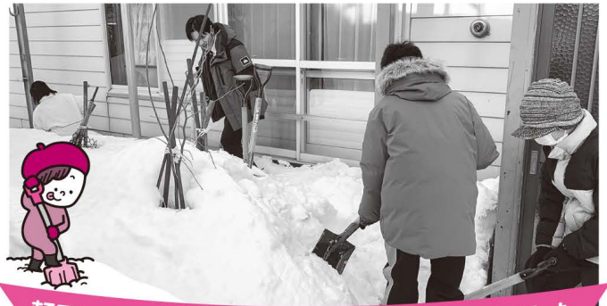
軒下にたまった雪などを除排雪していただきました