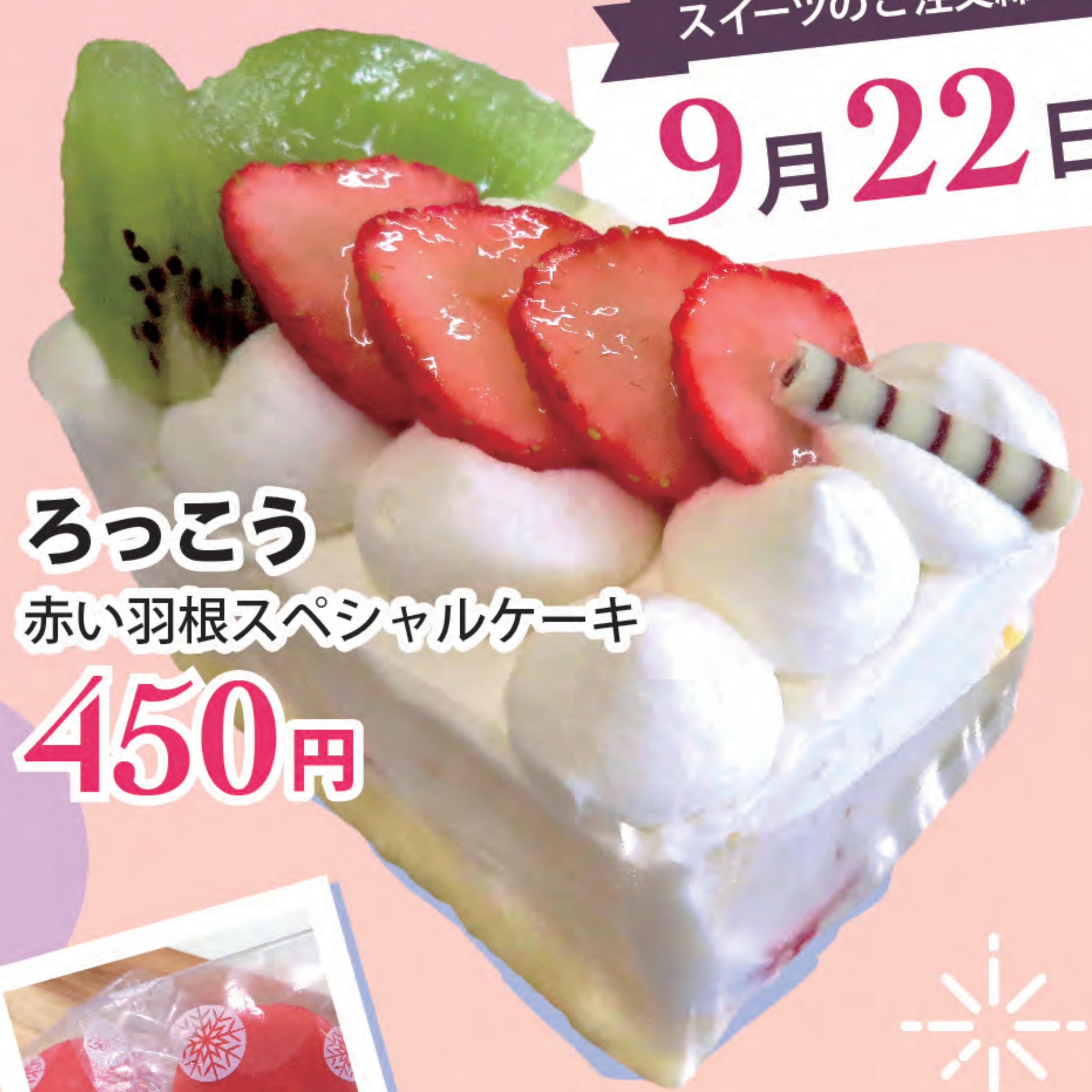
ろっこう 赤い羽根スペシャルケーキ 450円