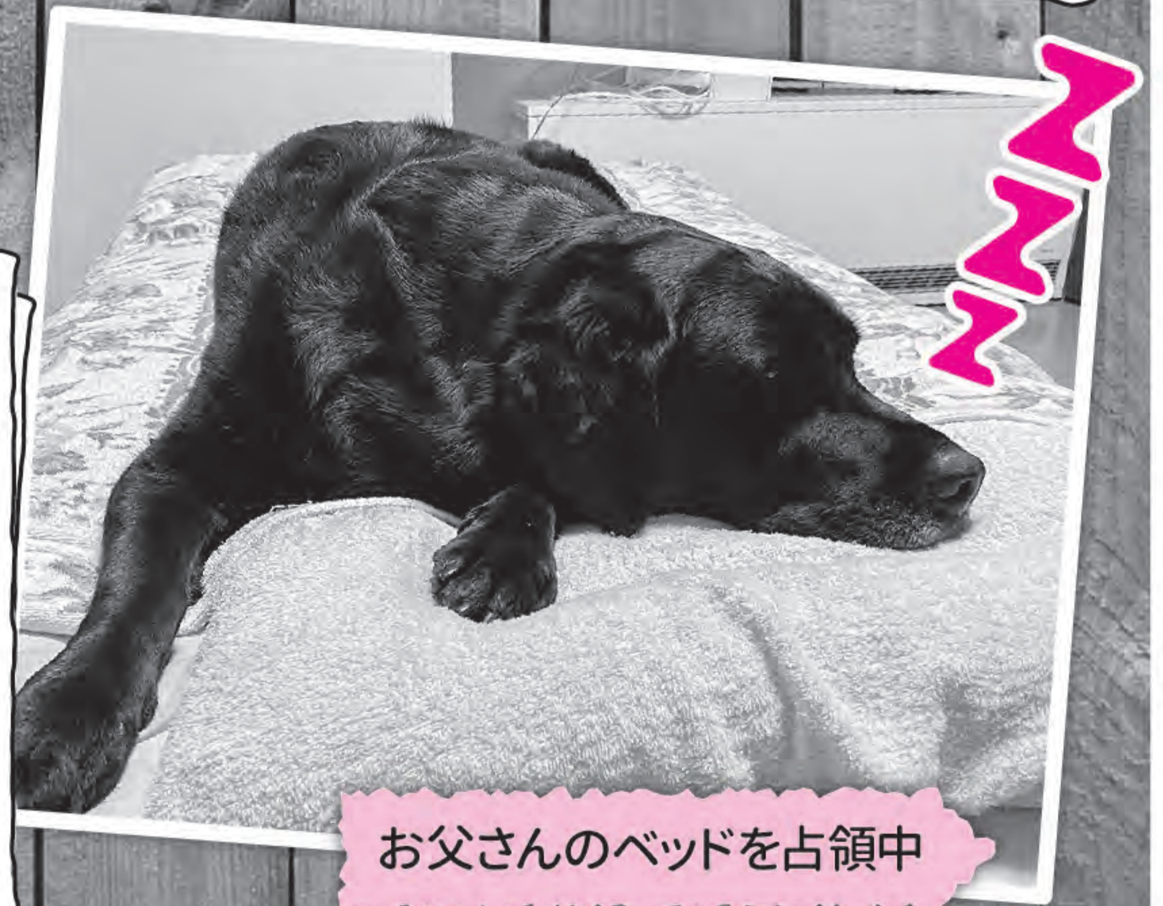
お父さんのベッドを占領中

職場ではお父さんから片時も離れない彼女も、自宅ではすっかり安心してリラックスモードに。お父さんが寝る準備をしている間に、こっそりベッドに潜り込んで占領していることもあるようです。