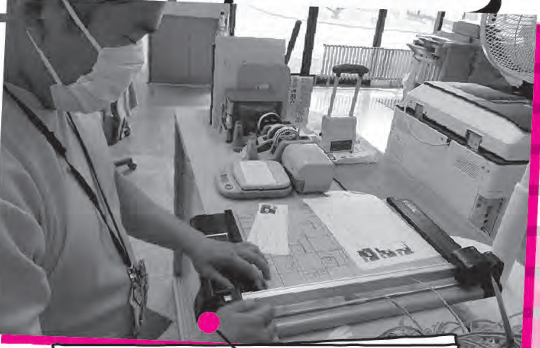
ボランティアさんも大活躍！