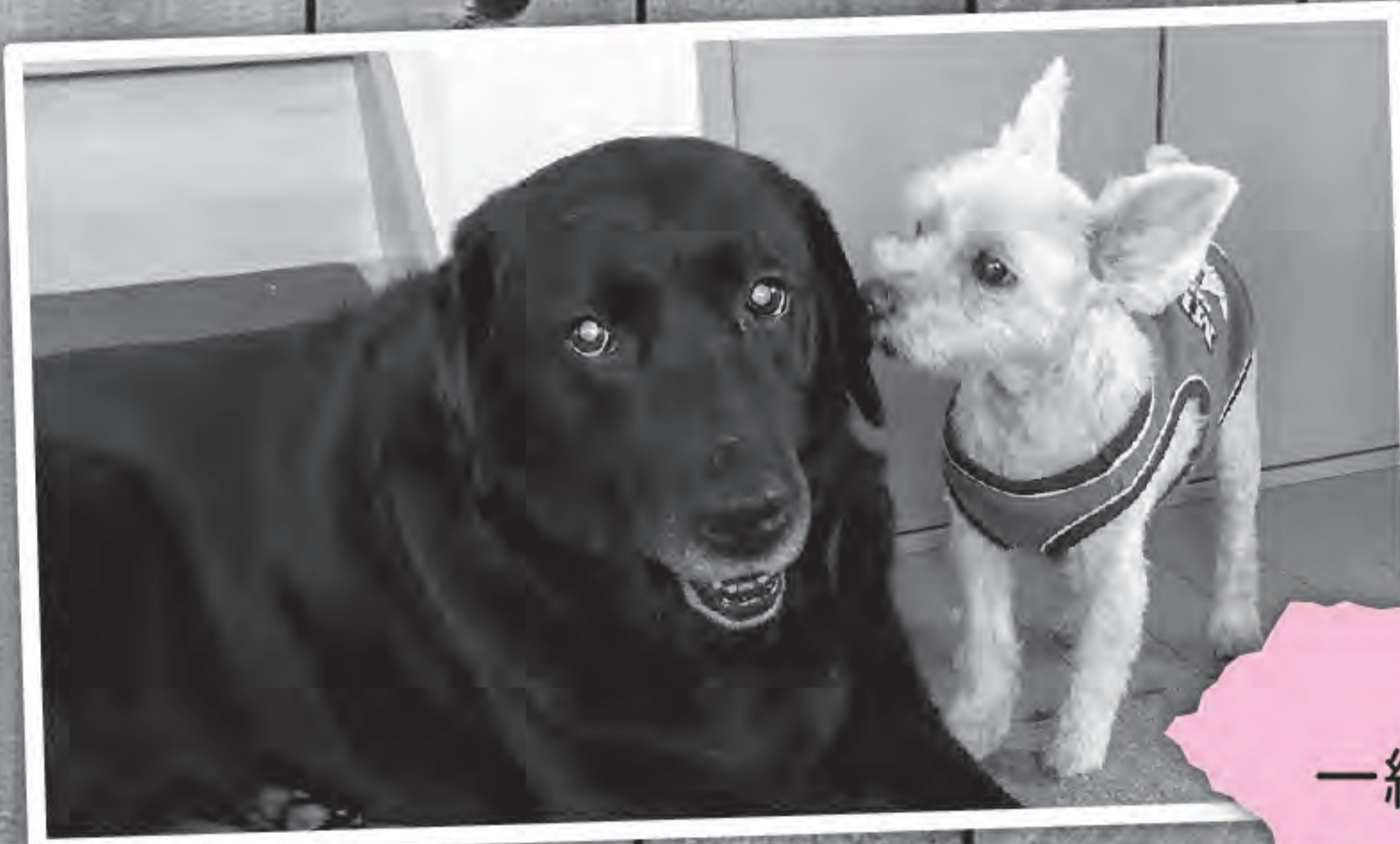
先輩犬のチロと一緒にくつろぐビビアン

今日は富良野社協のセラピー犬「ビビアン」の家族をご紹介します♪ ビビアンは現在、飼い主のお父さん(局長)とお母さん、そして先輩犬お兄ちゃんの「チロ」と4人(犬)暮らしです。