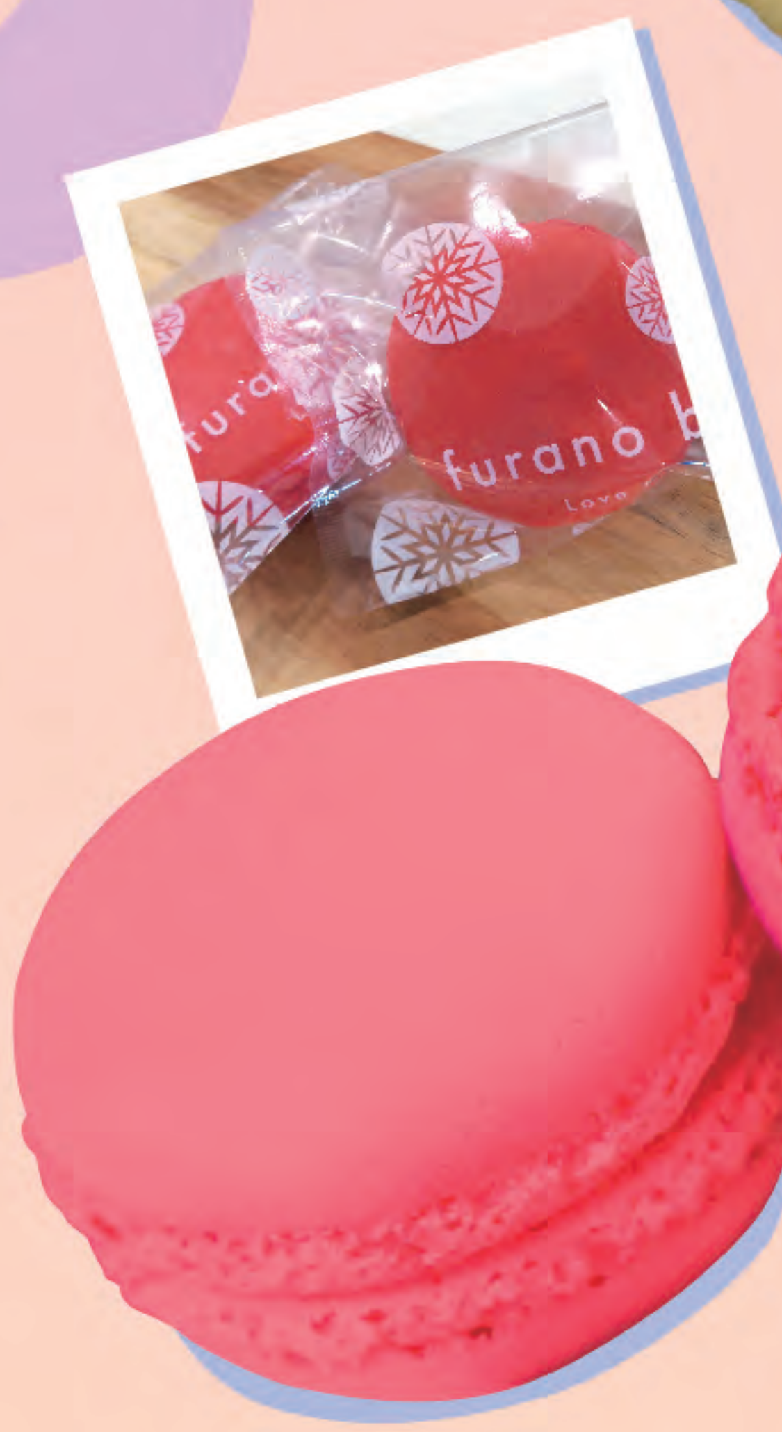
フラノビジュ furano bijou マカロンフランボワーズ 1個 390円