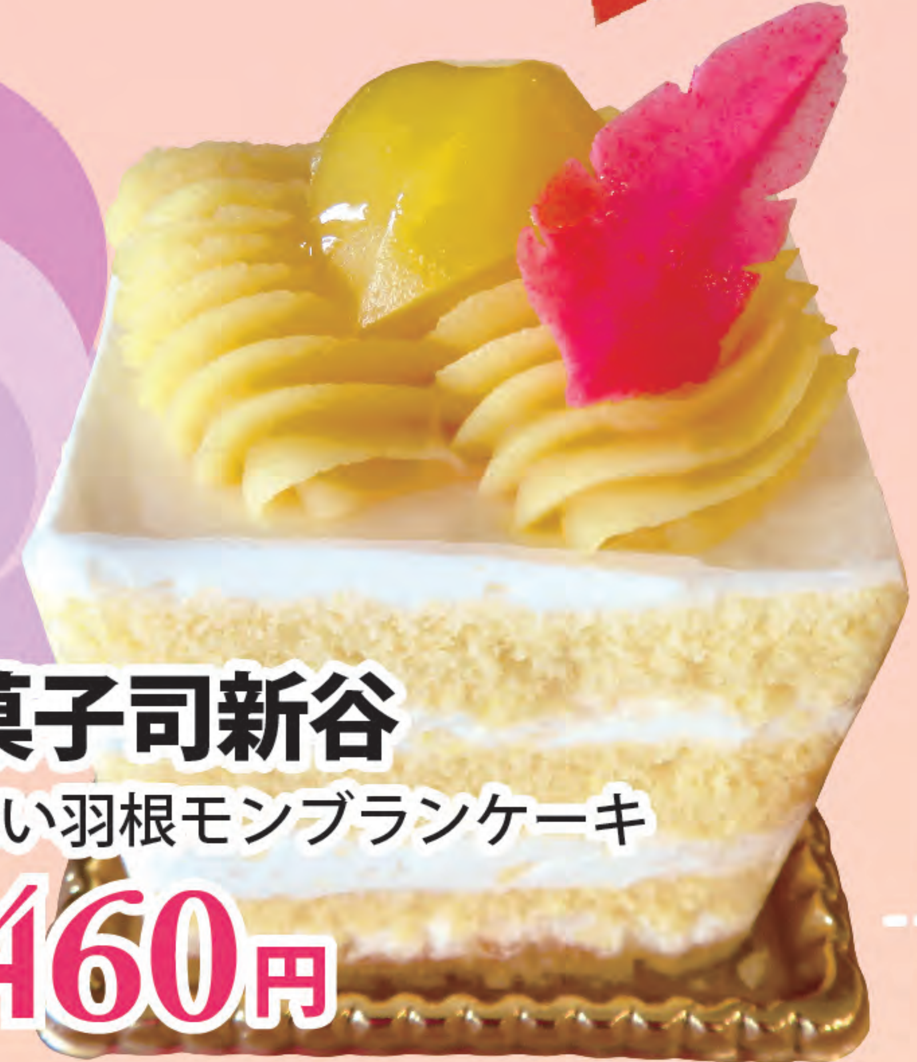
菓子司新谷 赤い羽根モンブランケーキ 460円