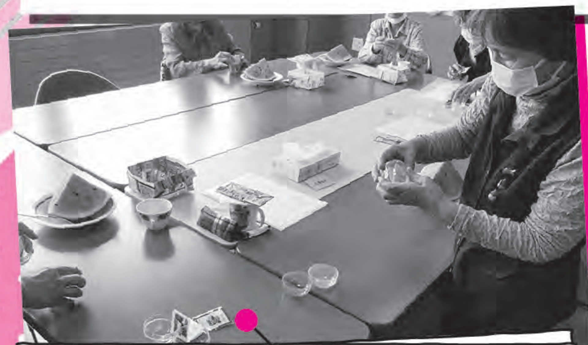
ピンバッジと気持ちのこもった メッセージをカプセルに入れました♪

設置場所は マルシェ2タマリーバ トイレ前となります！ ぜひ見つけてくださいね！