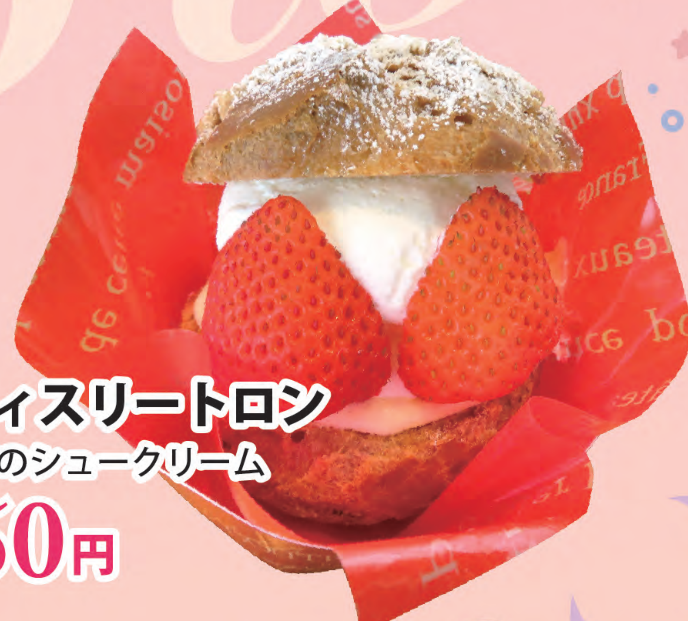
パティスリートロン イチゴのシュークリーム 550円