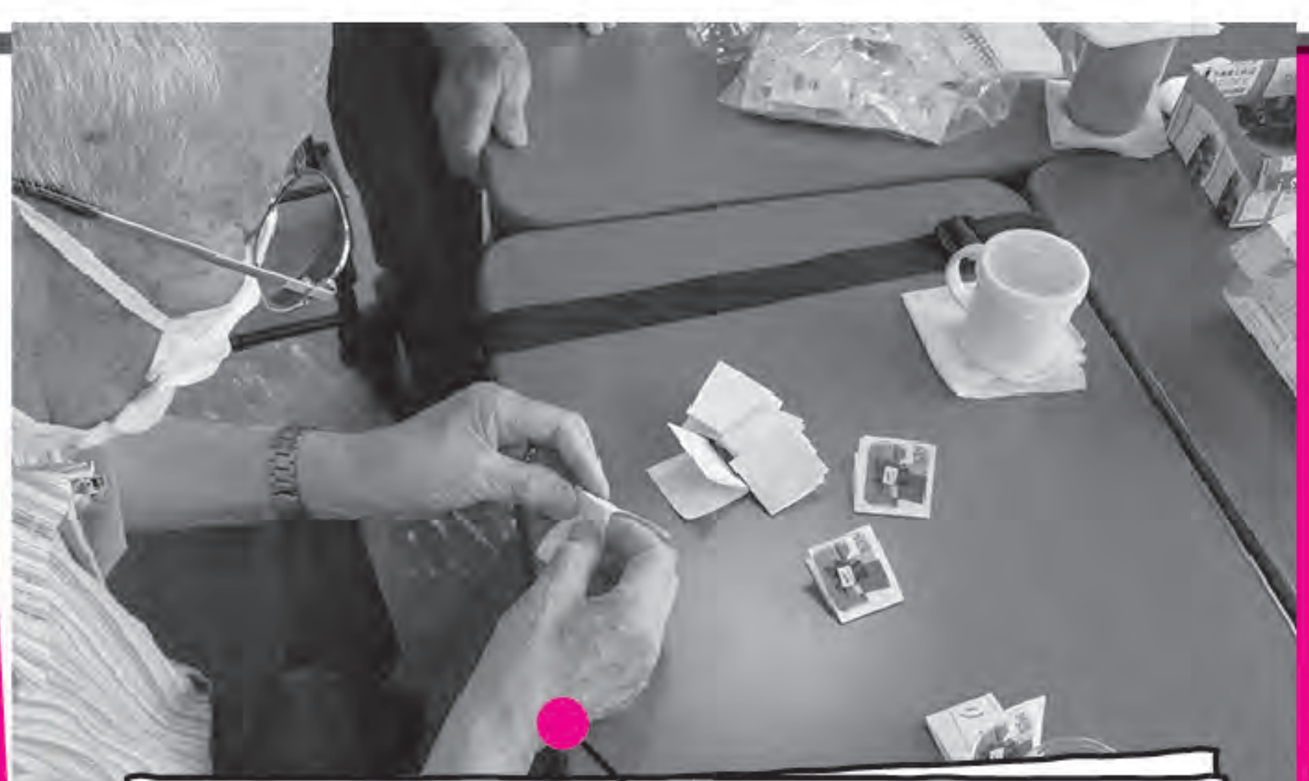
メッセージは何か書いてあるか お楽しみ♪