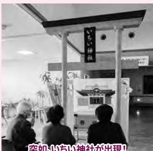
突如、いちい神社が出現! 初詣の参拝をしました