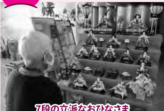
7段の立派なおひなさま 「きれいだねえ～」