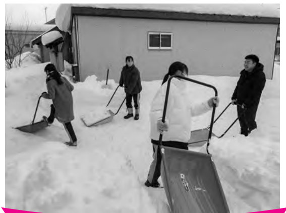
軒下にたまった雪などを除排雪していただきました

除雪ボランティアにご協力いただいた多くの皆さまの温かな思いやり、助け合いの心が広がった活動となりました。ご協力をいただきました皆さま、本当にありがとうございました。