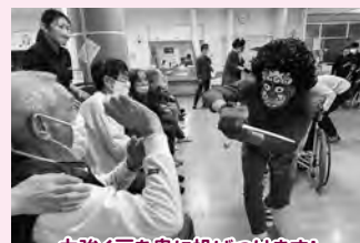
力強く豆を鬼に投げつけます! 「い、痛いよ～(泣)」