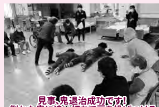
見事、鬼退治成功です! 倒れた鬼に追い打ちで豆を投げつける お茶目な利用者さん(*^_^*)

デイサービスセンター いちいを利用してみたい! 家族への利用を勧めて みたいけれど不安...という方は、 体験利用もできますので お気軽にお問い合わせください!