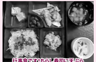
行事食です!ちらし寿司に天ぷら さらに嬉しいケーキまで!