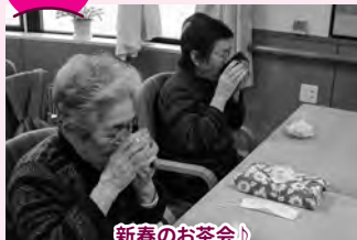
新春のお茶会♪ 職員が点てたお抹茶とお菓子でまったり