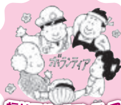
福祉団体・ボランティアへの活動支援に