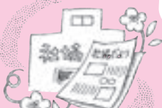
広報誌発行事業に