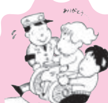
ホームライゼーションの推進事業に