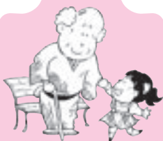
歩行不安定の方の安全杖支給事業に

このような事業に、市民の皆様からの会費を有効に使用させていただいております。皆様の温かい思いやりが、富良野のまちを支え、まちを作っています。これからも皆様のご理解とご協力をよろしくお願いいたします。