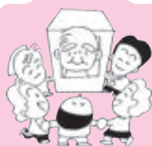
福祉のまちづくり事業に

富良野市社会福祉協議会では、下記の各種事業を実施しています。これらの事業には市民の皆様からご協力いただきました会費の一部が使われており、福祉活動に役立てられています。