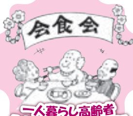
一人暮らし高齢者ふれあいの集い事業に