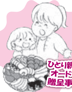
ひとり親世帯オードブル贈呈事業に