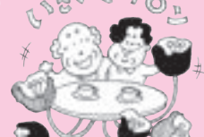
地域福祉の推進事業に