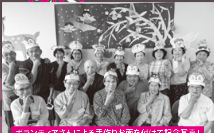
ボランティアさんによる手作りお面を付けて記念写真!

8月8日(日)、毎週日曜日に開催している託老事業にて夏祭りを開催しました!「くじ引き」「射的」「たこやきビンゴ」「輪投げ」「ヨーヨー釣り」など盛りだくさんでした!ほとんどが、段ボールを使った託老ボランティアさんによる手作り、各ゲームではみんな大好きな懐かしの駄菓子が景品でした。ゲームの休憩時間ではマクドナルドのシェイクとチョコバナナパイの縁日セットを食べ、夏祭り気分を味わうことができました!最後はみんなでお面を付けて写真撮影を行い、夏の一大イベントをみんなで楽しむことができた一日でした!